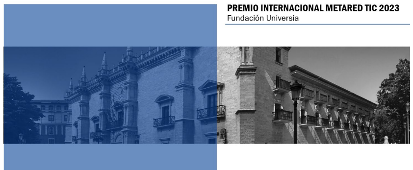
PREMIO INTERNACIONAL METARED TIC 2023 Fundación Universia