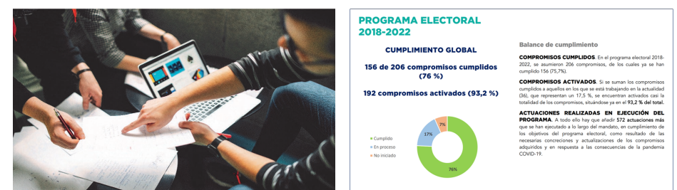
Participación y rendición de cuentas