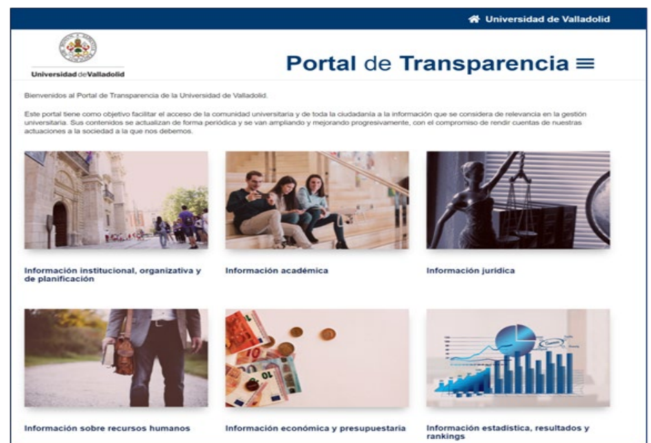
Portal de transparencia

La aplicación de las TIC y el proceso de transformación digital de nuestra Universidad han sido claves para la ejecución de este proyecto.